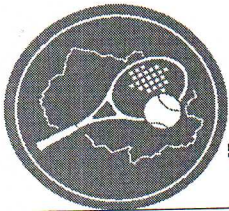
ТАБЛИЦА ОСНОВНОГО ОДИНОЧНОГО ТУРНИРА на 4 участников, проводимого по круговой системе русской летней Универсиады 2016 года области по теннису"